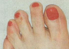
VORHER: Der zweite Zeh war der Patientin zu lang

Für Fuß-Verformungen gibt es laut Wiethoff übrigens zwei Ursachen: Genetik und High-Heels. knyp